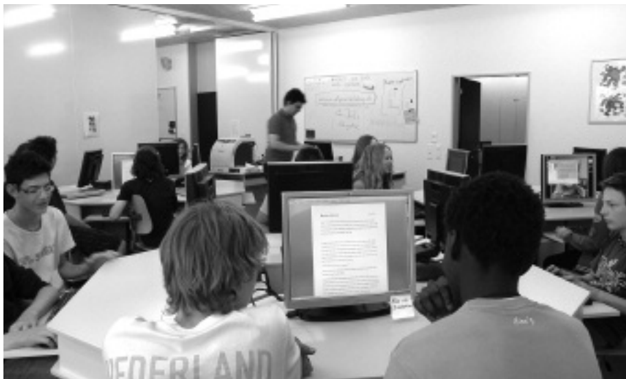
Letzter Schliff an einer der 23 Kurzgeschichten: Ab sofort ist das Buch der Oberstufenschülerinnen und -schüler auch im Handel erhältlich.