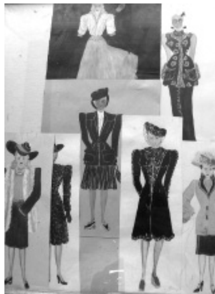
Vor 63 Jahren entstanden...