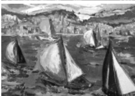
Oben: Design-Entwurf; Unten: am Zürichsee