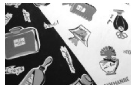
Plakat und Design-Entwurf